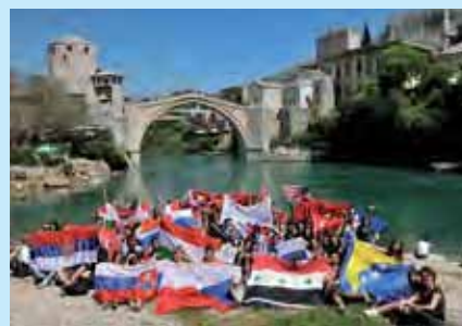
Alumnos del Colegio de Mostar, Bosnia.

A la hora de seleccionar a los candidatos, el Comité Español de los Colegios del Mundo Unido no sólo