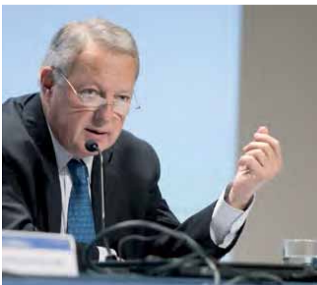
Federico Reyes Heróles Palacio de los Duques de Pastrana, 16 de Octubre de 2012, Madrid, España

CONFERENCIA PRONUNCIADA POR FEDERICO REYES HEROLES EN LA CLAUSURA DEL XI ENCUENTRO IBEROAMERICANO DE LA SOCIEDAD CIVIL CELEBRADO EN MADRID LOS DÍAS 15 Y 16 DE OCTUBRE DE 2012.