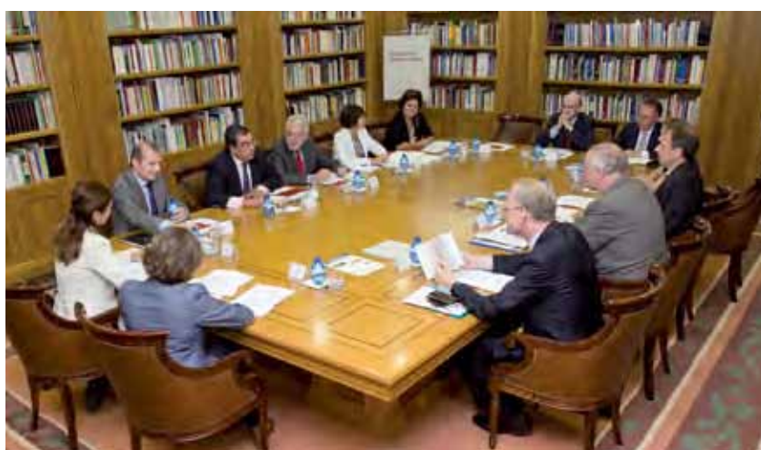
Representantes de las juntas directivas de las asociaciones de fundaciones de España y de Alemania.

En el caso español y en relación con los aspectos normativos que afectan a las fundaciones, se puso de mani-