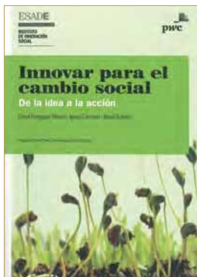
Título: Innovar para el cambio social.

La falta de claridad de ideas se relaciona con la complejidad conceptual del término innovación, y con la variedad de formas en las que se presenta en la práctica 3 . En otras ocasiones los profesionales del sector identifican la innovación con la labor que hacen los departamentos de I+D+i de las empresas, para la que es necesaria contar con equipos de investigadores y personal muy especializado, con lo que las organizaciones más pequeñas, que carecen de estos recursos, la ven como una actividad inalcanzable para ellas.