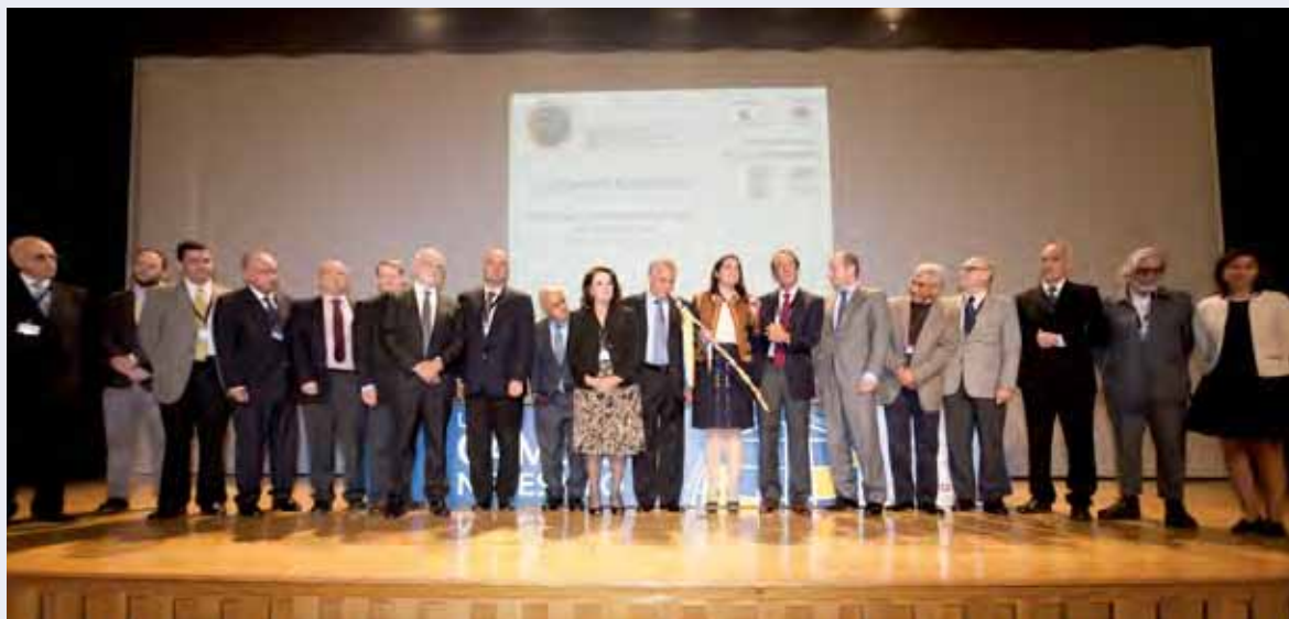
Miembros del Consejo Directivo en la clausura del IX Encuentro Iberoamericano.