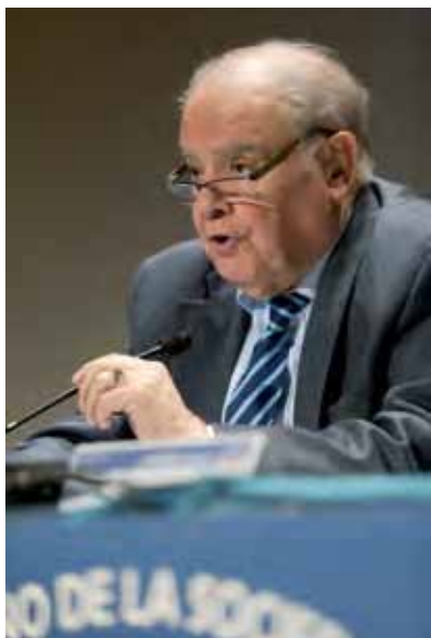
Enrique Iglesias, secretario general de la SEGIB.

en la que las minorías se organicen para reclamar pacífica y civilizadamente sus derechos, “en un mundo en el que los medios de comunicación coloquen a la sociedad en el núcleo central, dentro de un fenómeno social como es la actual situación de crisis”. Según Iglesias, “la crisis actual dará lugar a una nueva sociedad, a una nueva economía en el conocimiento, y a un nuevo sistema de relaciones internacionales”.