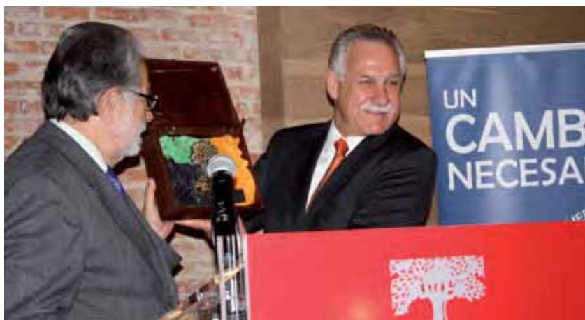
Entrega del Premio OCIB a los Encuentros Iberoamericanos de la Sociedad Civil.

Los Encuentros Iberoamericanos han sido galardonados con el Premio OCIB a la Cooperación Internacional por la labor realizada en la construcción y el desarrollo de un foro de reflexión y debate en el ámbito iberoamericano para el fortalecimiento