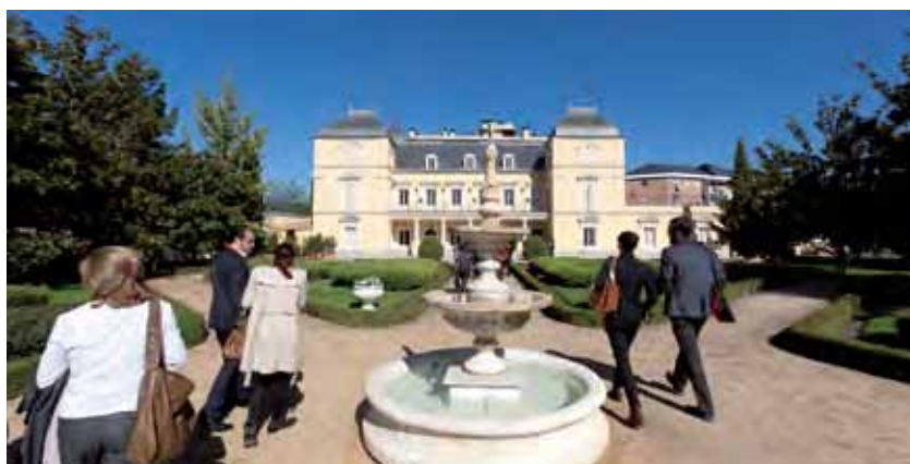
Palacio de Pastrana (Madrid).