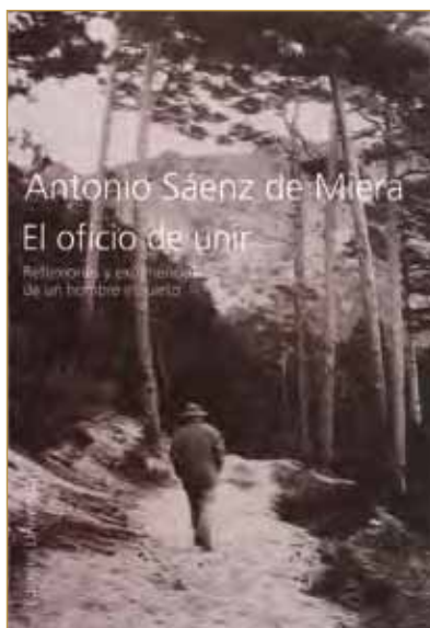
Título: El oficio de unir. Autor: Antonio Sáenz de Miera. Edita: Editorial Universitas. Madrid, 2012.

El principio arranca con la generación del 56, que tenía claro que la única salida para los licenciados en derecho de entonces eran las oposiciones. Sáenz de Miera se resiste a esta generalizada asunción y emprende su “primera vida” en el entonces desconocido mundo de la empresa, tras prepararse con esfuerzo y buenos maestros, y consigue abrirse camino en Hidroeléctrica Española, gracias también a ese punto de azar que rige casi siempre nuestro destino.